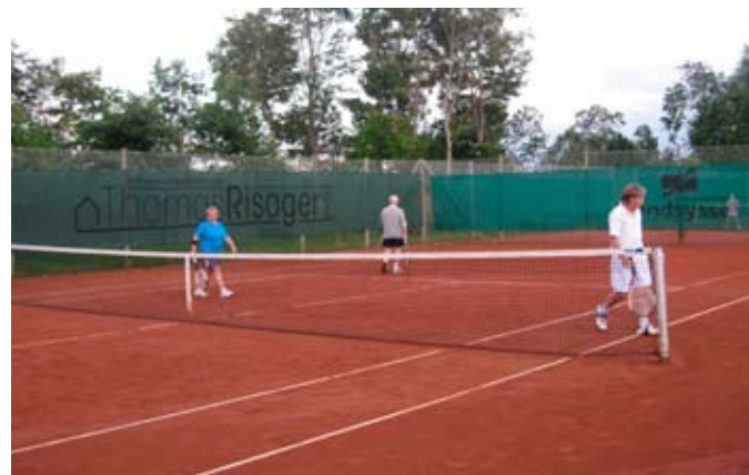
Mon han har givet op?