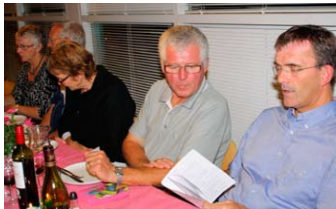
Så er vi klar til fællessang.