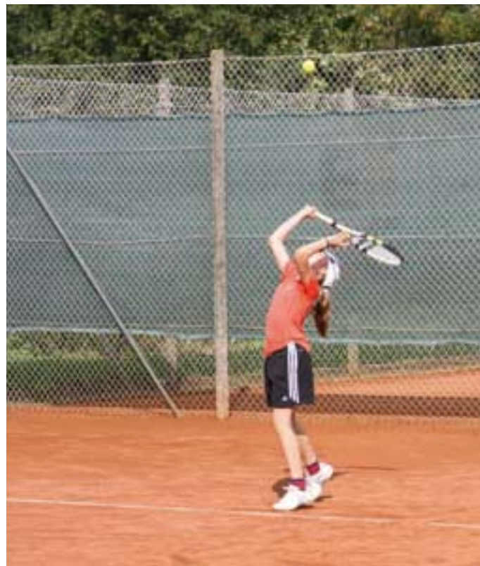
Bliver det et servees?