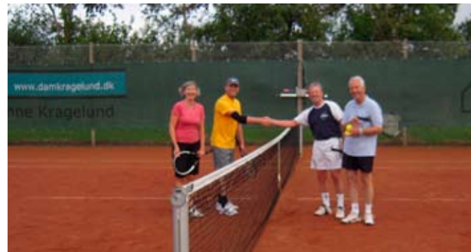
Finalen er afgjort, her bliver vinderne ønsket tillykke af 2'erne.