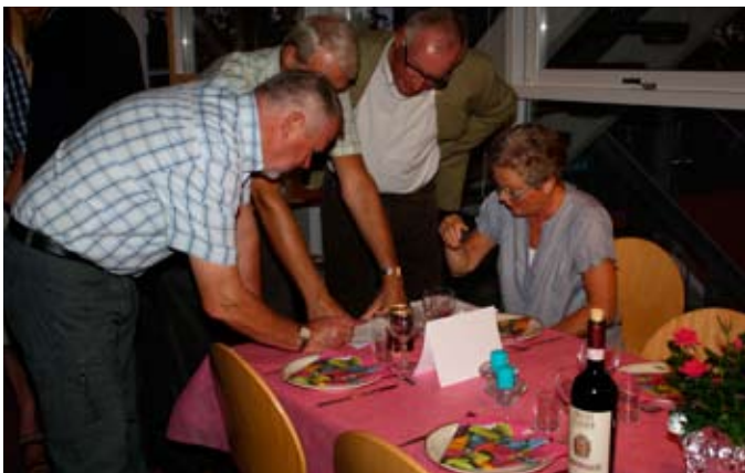
Skolemesteren er i gang med at regne bistået af udvalget.