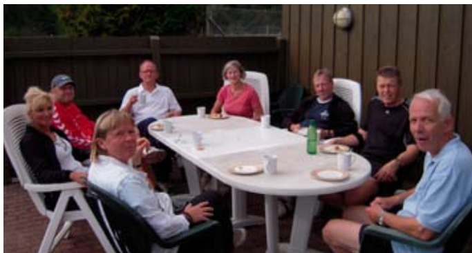
Det lille selskab slutter af med kaffe og brød.