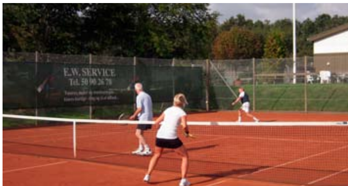
Der kæmpes på livet løs.