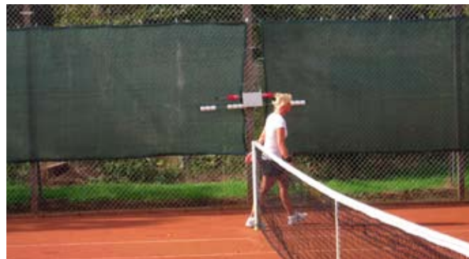
Der holdes styr på resultaterne.