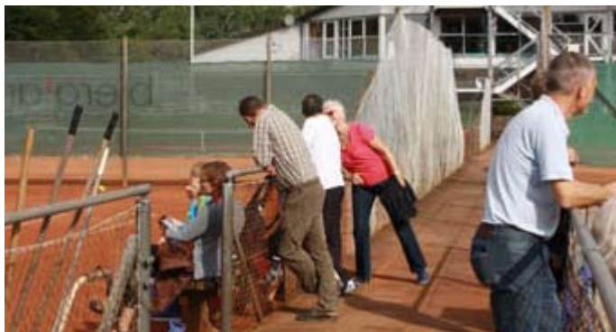
Tilskuerne hygger sig.