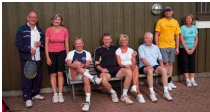
De få, men velmotiverede deltagere i årets "fidus"turnering.