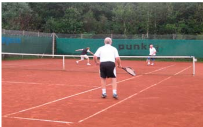
Hov, den smuttede.