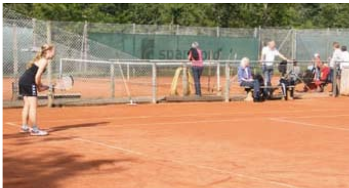
Deltagerne koncentrerer sig.