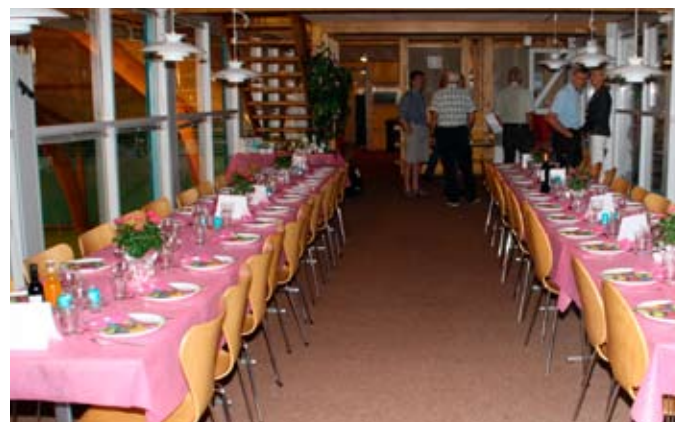
Så er der dækket op til festen.