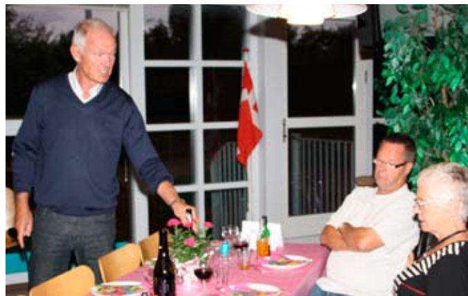
Formanden ser træet ud.