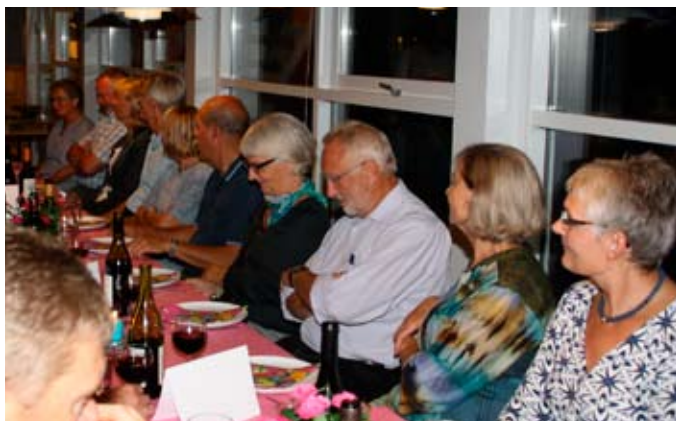
Så venter vi på flæskestegen.