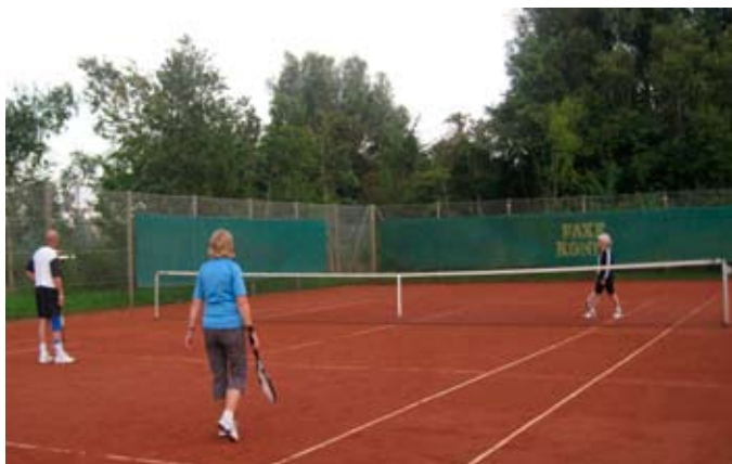
Spillet et i gang.